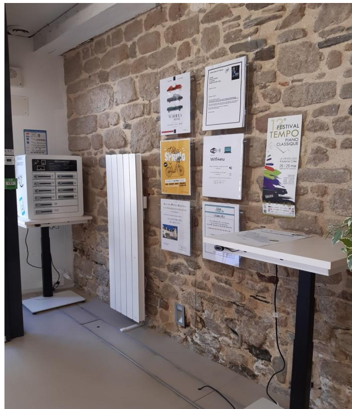
Table de consultation (utilisation du Wifi)